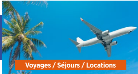
Voyages / Séjours / Locations

DANS LES CSE DONT LE BUDGET LE PERMET, LA CFDT A PROPOSÉ ÉGALEMENT DES :