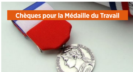
Chèques pour la Médaille du Travail

DANS LES CSE DONT LE BUDGET LE PERMET, LA CFDT A PROPOSÉ ÉGALEMENT DES :