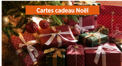
Cartes cadeau Noël