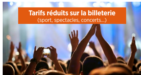
Tarifs réduits sur la billetterie (sport, spectacles, concerts...)