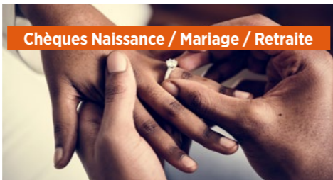
Chèques Naissance / Mariage / Retraite