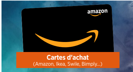
Cartes d'achat (Amazon, Ikea, Swile, Bimply...)